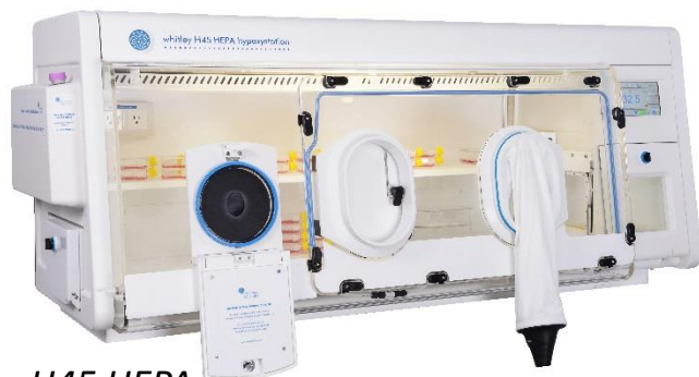
H45 HEPA Removable Front