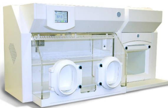
H85 大容量ポートで一度に多量の出し入れが可能