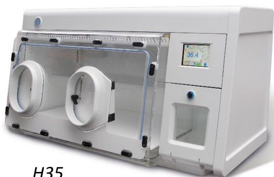
H35 Removable Front