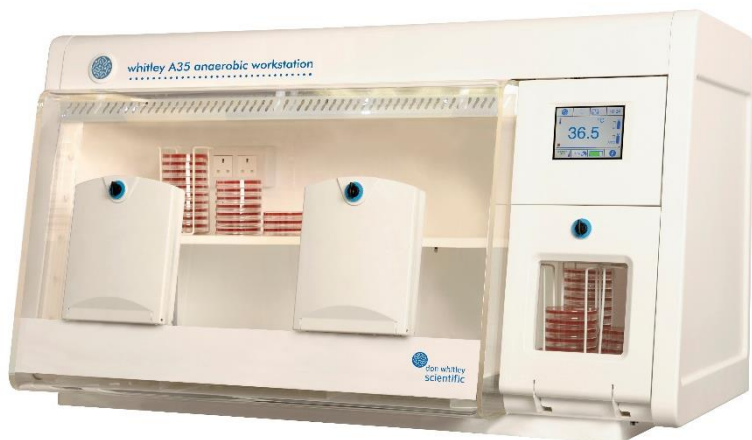
A35 Removable Front